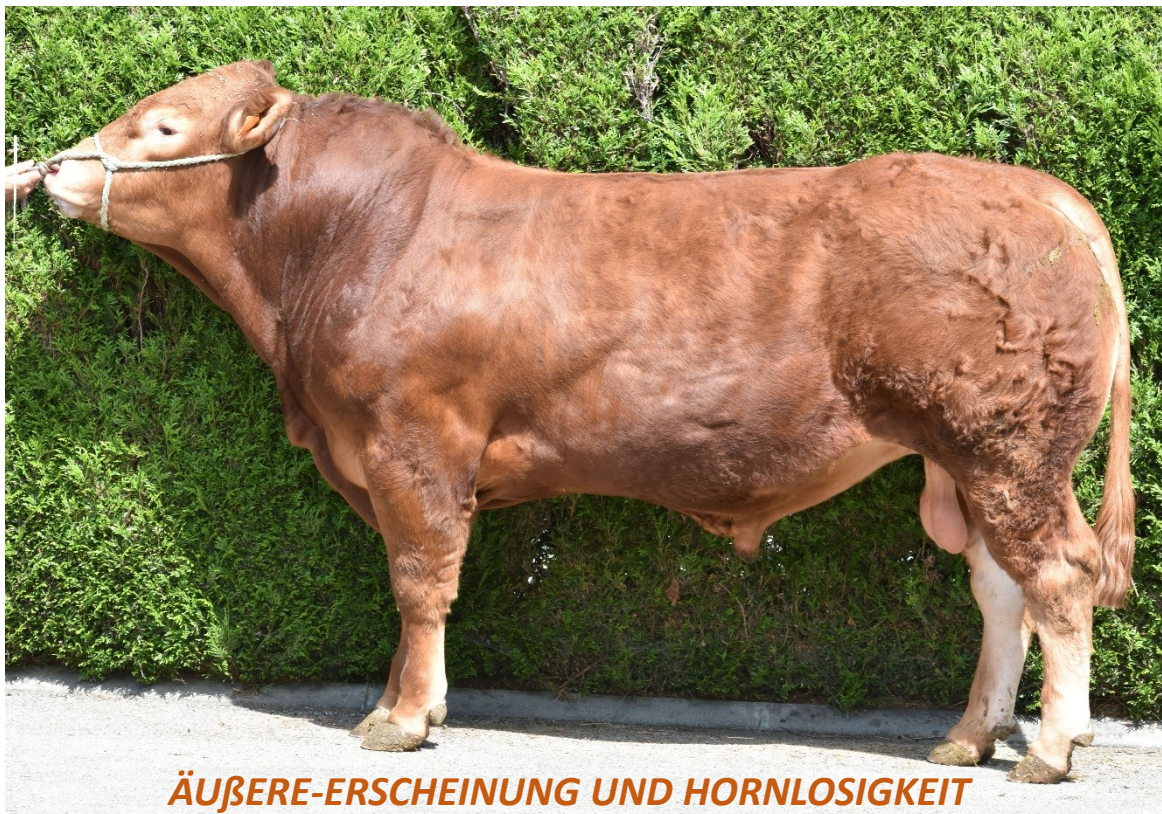
ÄUßERE-ERSCHEINUNG UND HORNLOSIGKEIT

NORSEMANPO bedeutet NORSEMAN Pp. NORSEMANPO ist ein Gemischt-Typ.