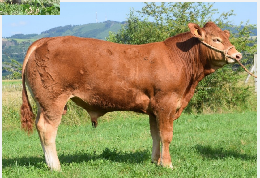
RIO Pp, Sohn von NERWIN Pp Betrieb Tourette Pierre (FR)