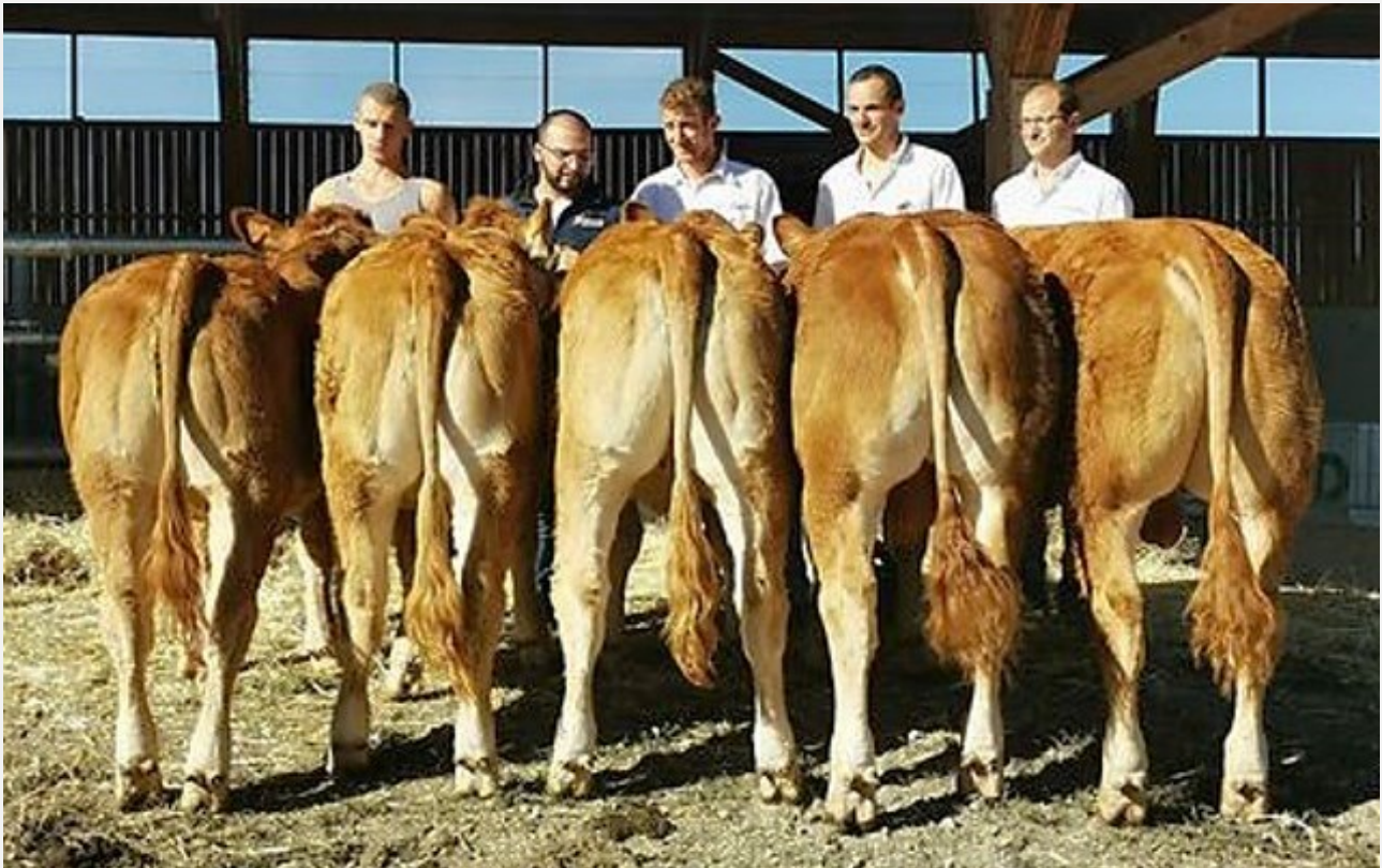
Nachkommen von NERWIN Pp

Die sehr gute Leichtkalbigkeit wurde durch zahlreiche Nachkommen in vielen Ländern bestätigt! Für Erstkalbungen geeignet.