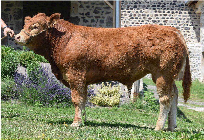
RASTA Pp, Sohn von NERWIN Pp Betrieb GAEC Limousine Safranée (FR)